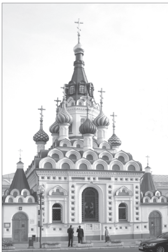
Архиерейское подворье — храм в честь иконы Божией Матери «Утоли моя печали» Саратова. Современный вид