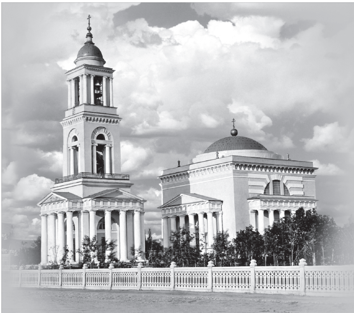
Александро-Невский кафедральный собор города Саратова. Разрушен в 30-е годы XX века

Еще в 1785 году императрица Екатерина II «милостиво повелеть соизволила» выстроить в Саратове новый собор вместо старого Троицкого собора. Благотворительная помощь императрицы заключалась в значительной для того времени сумме в 15 тысяч рублей, но по какой-то причине строительство было отложено 6 .