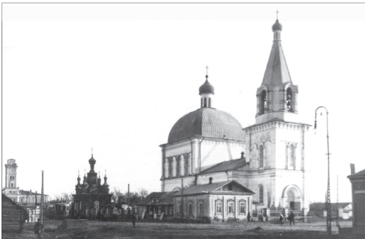
Митрофаньевская церковь города Саратова. Разрушена в 1934 году