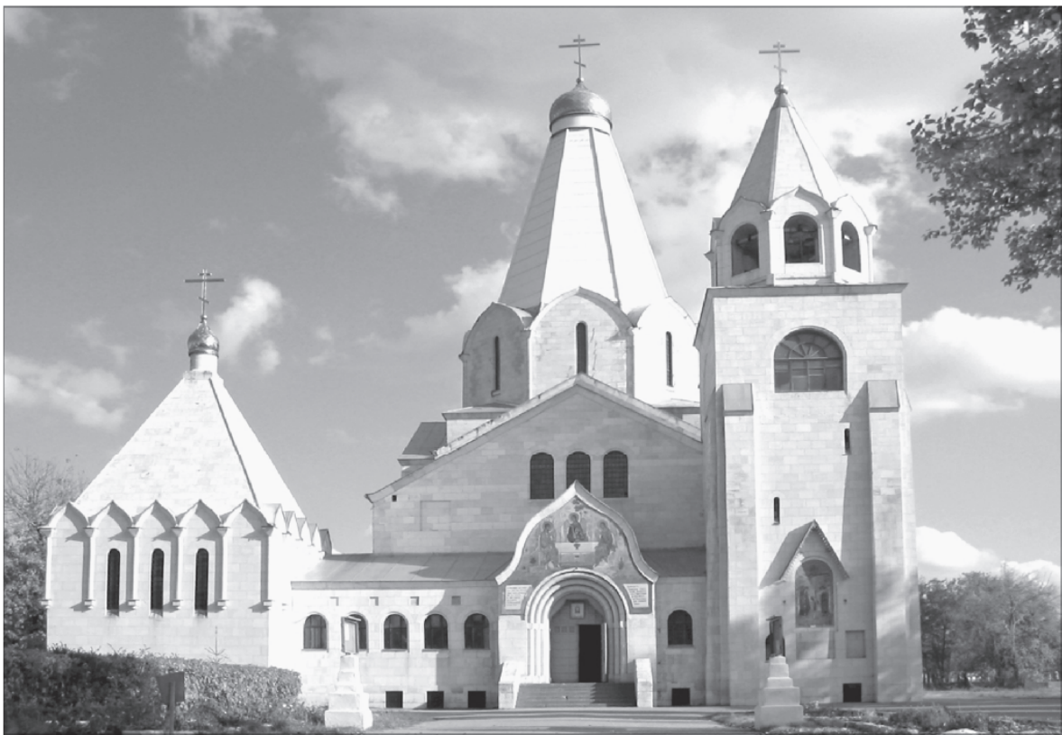
Троицкая церковь города Балаково. Современный вид

Модерн охотно использовал для декора внешних поверхностей зданий поливные изразцы и мозаику. Для Троицкого храма в мастерской известного петербургского мозаичиста В.А. Фролова были изготовлены три монументальные мозаики: образ Троицы Ветхозаветной, Нерукотворный Спас и икона «Знамение». Эскизы для мозаик выполнил известный московский иконописец и реставратор И.О. Чириков 35 .