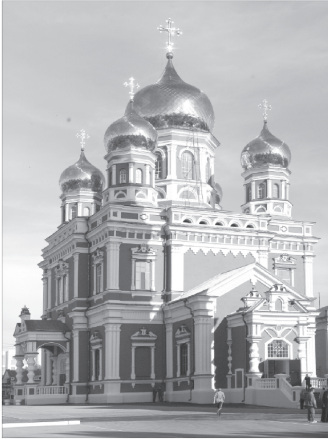
Церковь Покрова Пресвятой Богородицы в Саратове. Современный вид

Царицынскому (1882–1889), сообщал: «...строить нужно, а средств очень мало приготовлено; несмотря на это... начали строить, заключив с каменщиками контракт, чтобы в известные сроки поставлять материалы и платить за работу деньги... Кому не надоедал, кому не докучал я своими просьбами о помощи на постройку церкви!.. Туго идет постройка, нет крупных жертвователей! При помощи Божией, хотя и в долг, церковь построена» 31 .