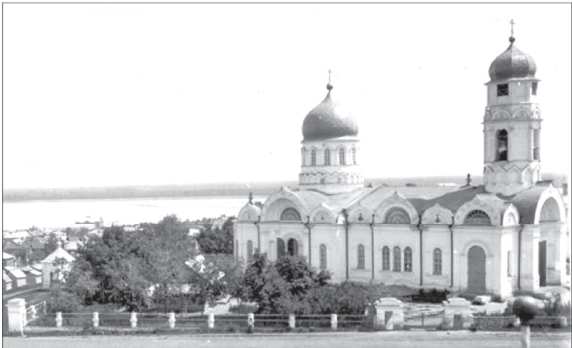
Покровская церковь города Вольска. Разрушена в начале 1930-х годов