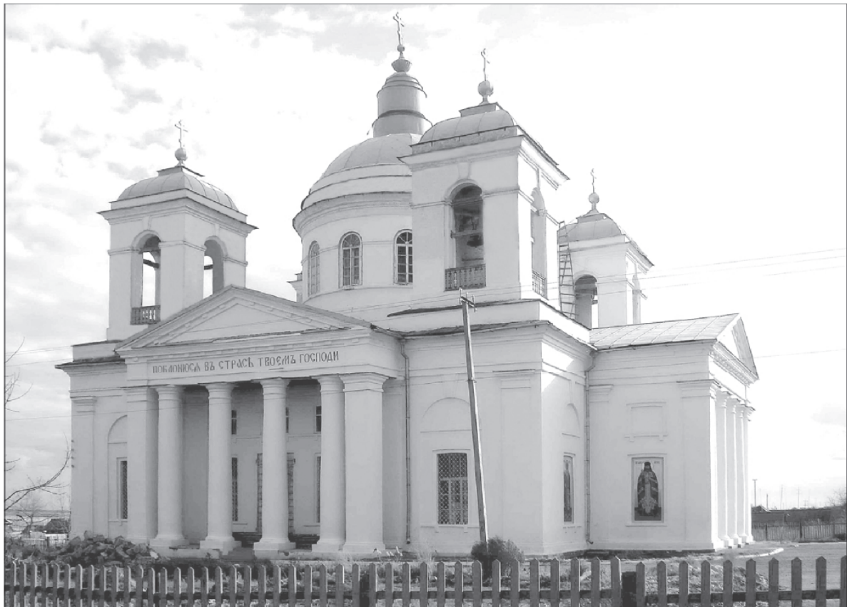
Свято-Троицкая церковь в селе Золотом. Современный вид