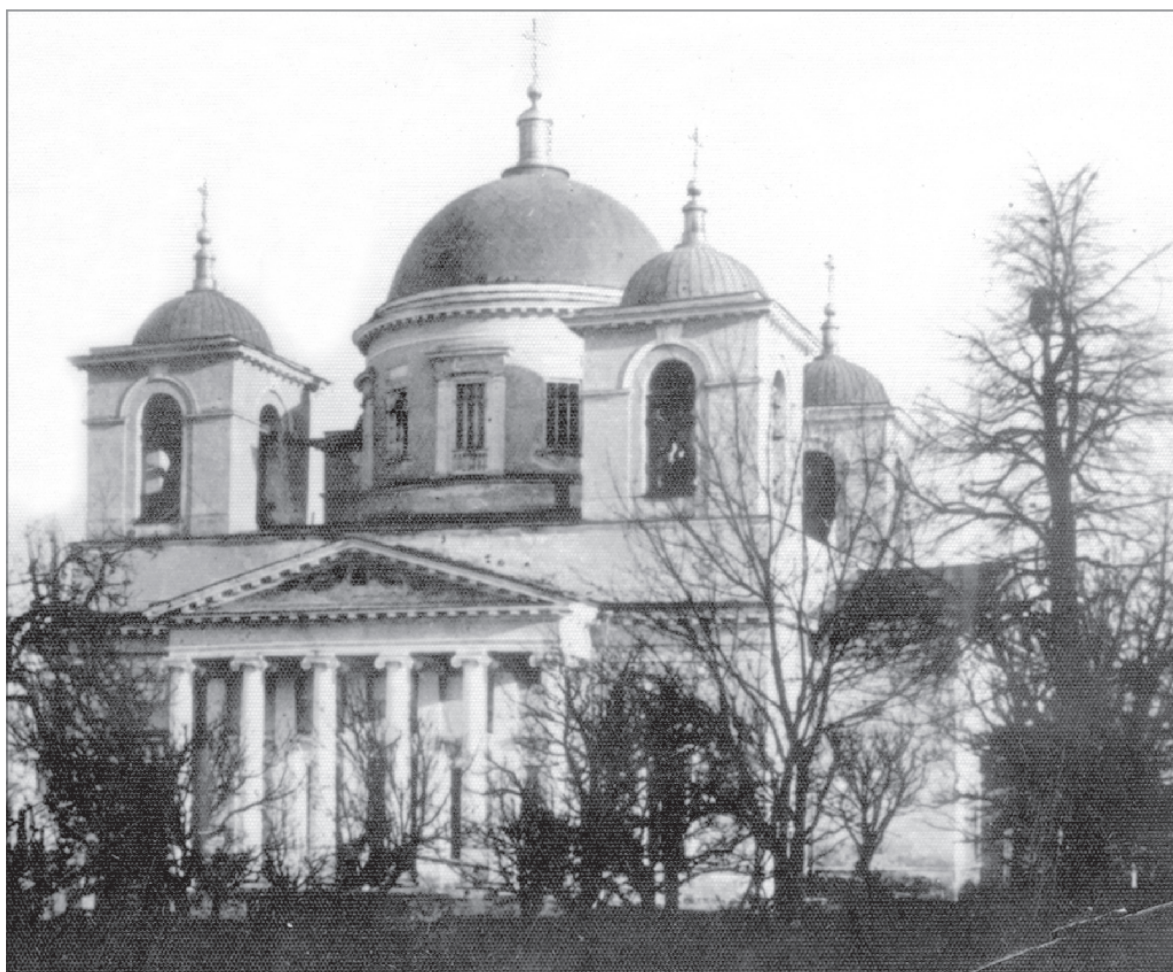
Спасо-Преображенский собор мужского монастыря. Разрушен в конце 20-х годов XX века

знаменитого пожара 1811 года. Оплакав потерю, настоятель архимандрит Савва отправился в Санкт-Петербург к обер-прокурору Синода князю Александру Николаевичу Голицыну. Смета, которую он вез с собой, была рассчитана на внушительную для того времени сумму в 184 799 рублей. После троекратного отказа со стороны Министерства внутренних дел архимандрит Савва сумел разжалобить Комиссию духовных училищ, которая выдала требуемую сумму. Преосвященный епископ Афанасий решил строить новый монастырь за городом, и саратовский гражданский губернатор Алексей Давыдович Панчулидзе отвел обители одиннадцать с лишним десятин земли к северу от Саратова.