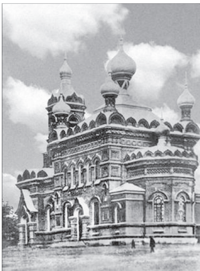
Покровская старообрядческая церковь в Хвалынске. Дореволюционный вид

Однако торжеству модерна в русской архитектуре предшествовало еще одно течение, которое вышло из границ историзма. Это так называемый кирпичный стиль, разнообразный и неоднородный, который на русской почве обогатился национальными элементами и стал называться стилем императора Александра III.