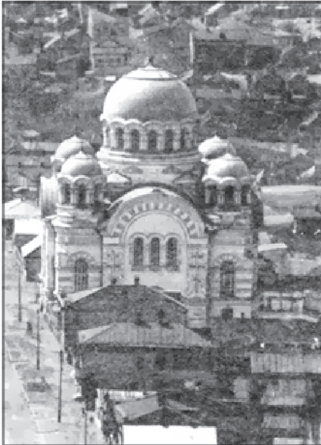
Ново-Никольская церковь на улице Большая Горная в Саратове. Разрушена в 1930-е годы