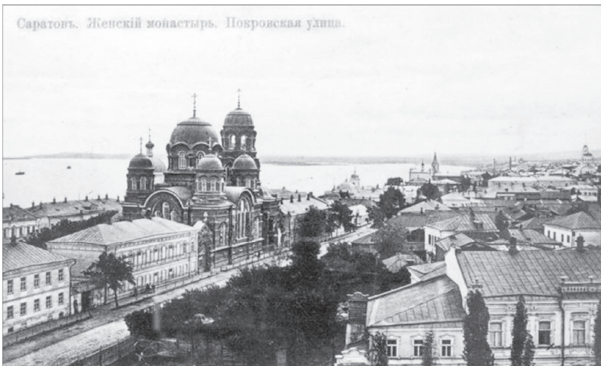
Никольская церковь Крестовоздвиженского женского монастыря. Разрушена в 1930-е годы