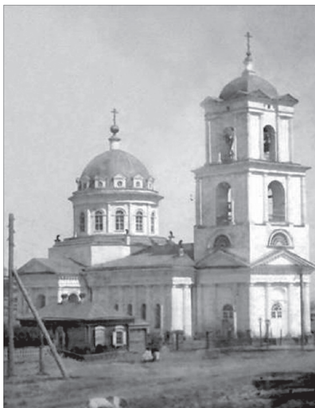
Троицкий собор города Вольска. Разрушен в 1934 году. Ныне восстановлен

Классицизм оказался чрезвычайно распространенным в храмовом строительстве Саратовской епархии. Среди ранних памятников следует назвать Троицкий собор в городе Вольске, строившийся с 1793 по 1806 год.