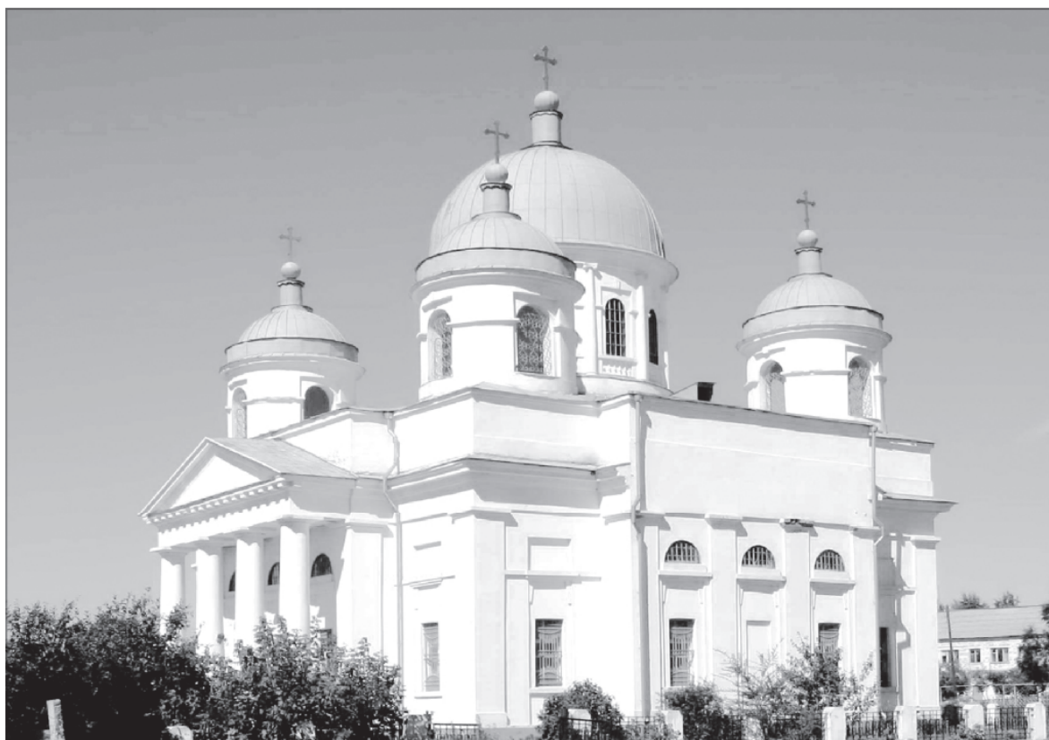
Храм в честь Знамения иконы Божией Матери в Черкасском. Современный вид

Годом позже в Саратовской епархии появился еще один замечательный храм в стиле классицизма. Это Знаменская церковь в имени графа Сергея Семеновича Уварова в селе Черкасском.