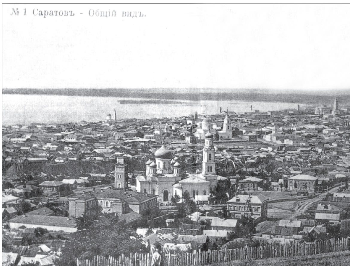
Панорама Саратова. XIX век

Искусствоведы, специализирующиеся на иконописи, отмечают интересный факт: не существует двух одинаковых икон, даже если они имеют один сюжет, написаны в одно время и, может быть, вышли из одной мастерской. То же самое можно сказать и о тысячах православных храмов, построенных на необъятных просторах Руси за тысячу лет ее христианской истории. Каждый православный храм имеет свое лицо, свой неповторимый облик, уникальное очарование, заставляющее всматриваться в него человека, не потерявшего живое чувство красоты.