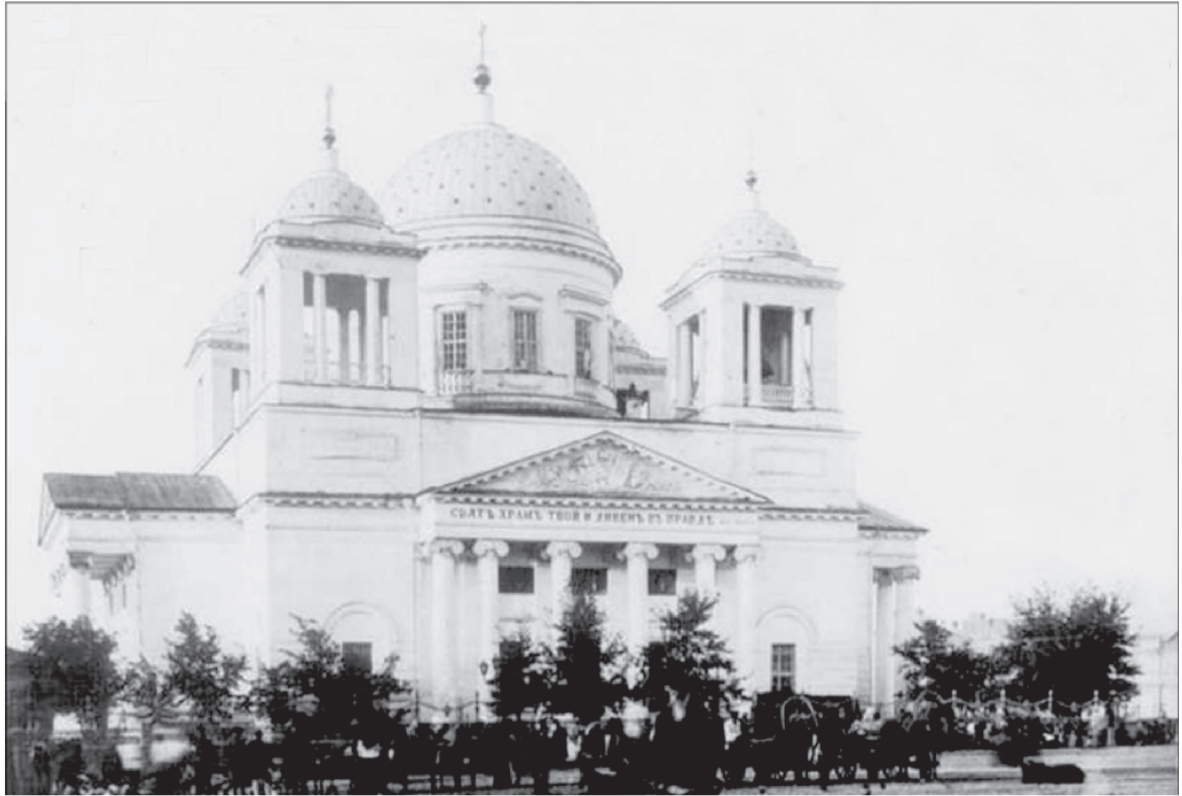
Иоанно-Предтеченский кафедральный собор в Вольске. Разрушен в начале 1930-х годов