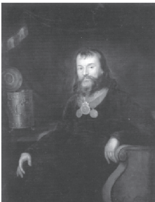
Портрет В.А. Злобина. Неизвестный художник. ГИМ

архипастырю Преосвященному Моисею (Близнецову-Платонову) 15 .